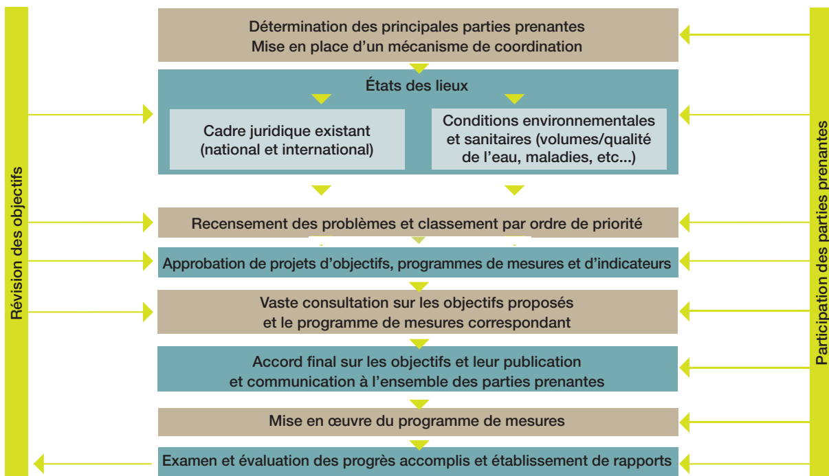
Figure 1. Cadre logique du processus de définition des objectifs