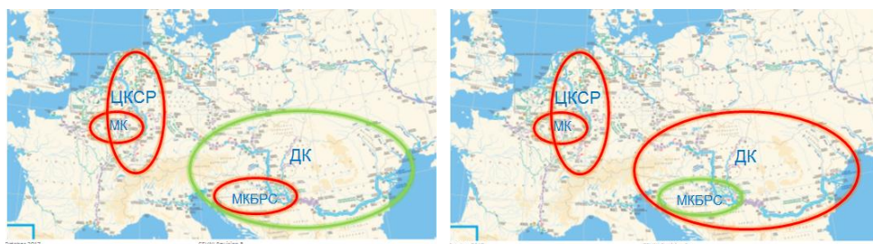
a) Четвертое пересмотренное издание ЕПСВВП