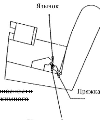
Рис. 3 Проверка на совместимость (см. пункты 2.6.1 и 3.2)

На рисунке показана только часть ремня, прижимающая бедра