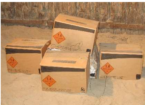
Fig. 4 Résultat de l'épreuve avec confinement