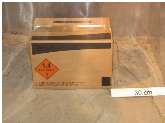
Fig. 1 Épreuve sur un seul colis sans confinement

10. Les figures ci-dessous sont les illustrations d'épreuves réalisées, avec ou sans confinement, sur des boîtes en carton remplies de sable, avec utilisation de détonateurs à retardement.