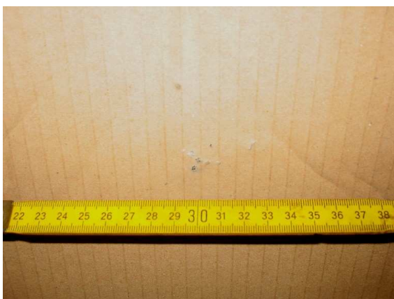
Fig. 6 Paroi intérieure de la boîte en carton