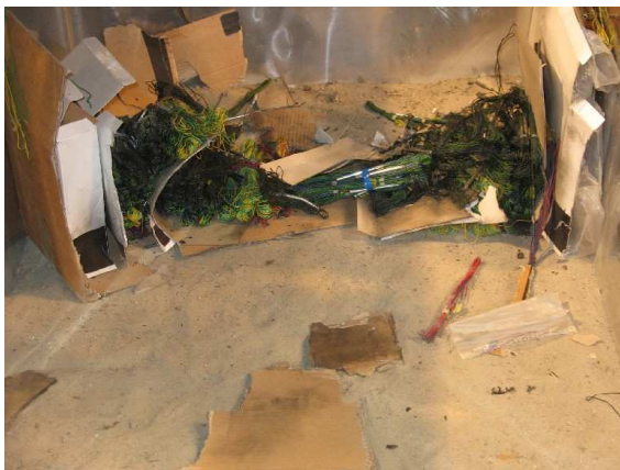
Fig. 2 Résultat de l'épreuve sans confinement