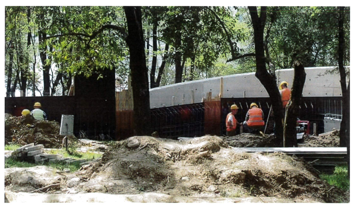
Construction work on the "children's playground" in the Lake Park

During his election campaign in 2015, pathological lier – excuse me, "socialist" crown prince and Mayor of Tirana – Erion Veliaj promised that he would put an end to the "betonization" of Tirana, and specifically the Lake Park, which had been the subject of illegal deforestation during (current opposition "leader") Basha's term as mayor in order to make room for construction work opposite to the Faculty of Economics, a "multifunctional complex (http://acp.al/projects/314/Godine-banimi-dhe-sherbimesh-2,7-dhe-13-kate-mbi-toke-dhe-2-nen-toke,-ne-Rrugen-e-Elbasanit/)" designed by German architecture firm Bolles+Wilson (which has recently gotten away with the defacement (http://www.berfrois.com/2015/02/vincent-w-j-van-gerven-oei-urban-politics/) of Korça's skyline). Ironically, it is exactly the same company that is responsible for the design of the so-called "children's corner" in the Lake Park, where it is rapidly becoming obvious that anything except playing will be involved, to wit (http://opinion.al/foto-galeri-betoni-tek-parku-mori-forme/):