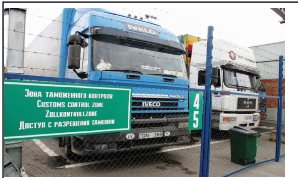
• ОЖИДАНИЕ ПОСЛЕ КОНТРОЛЯ