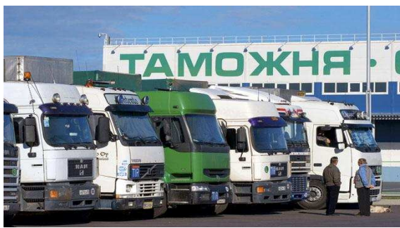
ОЖИДАНИЕ ПЕРЕД КОНТРОЛЕМ