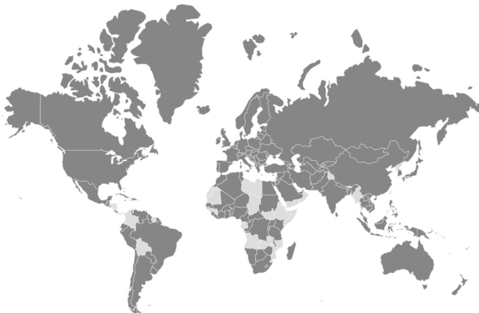
Рис. III Договаривающиеся стороны – члены и нечлены ЕЭК, которые являются договаривающимися сторонами по крайней мере одной конвенции по транспорту Организации Объединенных Наций

Условные обозначения: темно-серый цвет: договаривающиеся стороны; светло-серый цвет: страны, не являющиеся договаривающимися сторонами.