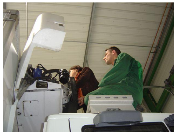
Vérification des équipements par des experts