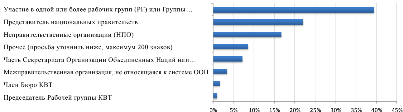
Рис. 4 Ответы в разбивке

44. Ответы свидетельствуют о поддержке деятельности КВТ, обращают внимание на сильные стороны и указывают на те области, в которых необходимо вести более активную работу. Более 70% респондентов сообщили, что КВТ «очень важен» в качестве международного форума для разработки правовых инструментов в области внутреннего транспорта. Около 90% респондентов решительно согласились или в целом согласились, что транспортные конвенции важны для их страны или организации. Являясь центром транспортных конвенций Организации Объединенных Наций, он рассматривается в качестве сравнительного преимущества КВТ, хотя нехватка ресурсов представляет собой сравнительный недостаток. В случае просьбы указать те области, которые нуждаются в большем внимании в будущем, заинтересованные стороны указали правила в области транспортных средств, безопасность дорожного движения и интермодальный транспорт. В то же время ни один из текущих видов деятельности не был сочтен ненужным – напротив, в целом было выражено пожелание укрепить их все.