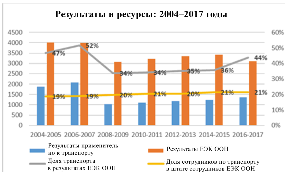
Рис. 3 Результаты и ресурсы: 2004–2017 годы

41. Нехватка ресурсов не дает возможности взять на себя новые задачи, если они не финансируются за счет внебюджетных ресурсов или если не завершены текущие задания.