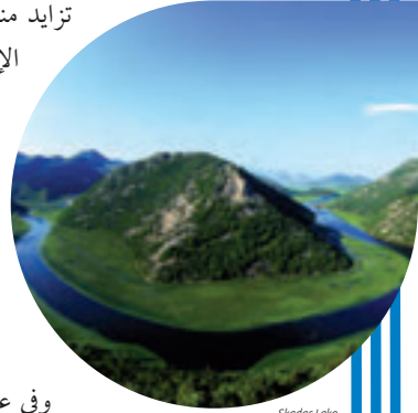
Skadar Lake - Montenegro

تزايد منذ السبعينات من القرن الماضي الاعتراف بالصلة بين الشواغل البيئية وحقوق الإنسان. وفي عام ١٩٩٢، كُرست هذه الصلة رسمياً في مؤتمر الأمم المتحدة المعني بالبيئة والتنمية أو "مؤتمر قمة الأرض" المعقود في ريو دي جانيرو، حيث اعتمدت ١٧٨ حكومة إعلان ريو بشأن البيئة والتنمية، الذي لا يزال اليوم يعتبر إعلاناً تاريخياً. وقد نص المبدأ ١٠ من إعلان ريو، وللمرة الأولى في صك دولي، على أن "قضايا البيئة تعالج على أفضل وجه بمشاركة جميع المواطنين المعنيين" وعلى أن "توفّر لكل فرد فرصة مناسبة للوصول إلى المعلومات" وعلى حق "المشاركة في صنع القرار" وإمكانية "الوصول بفعالية" إلى العدالة.