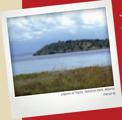
Lagoon of Narta, National Park, Albania Decius ©

في عام ٢٠٠٧، قدمت منظمة تحالف حماية خليج فلورا غير الحكومية بلاغاً إلى لجنة امتثال اتفاقية آرهُوس ادعت فيه أن المجتمعات المحلية لم تبلغ أو تستشر، على نحو ما تقتضيه اتفاقية آرهُوس، بخصوص خطط السلطات الألبانية من أجل إقامة مجتمع صناعي وطاقي كبير شمال مرفأ فلورا على الساحل الأدرباتيكي. وقد تضمن المشروع خططاً متعلقة بأنابيب للنفط والغاز، وتجهيزات لتخزين البترول، وثلاث محطات للطاقة الحرارية، ومحطة تكرير بالقرب من بحيرة نارتا الشاطئية، في موقع موجود داخل منتزه وطني محمي.