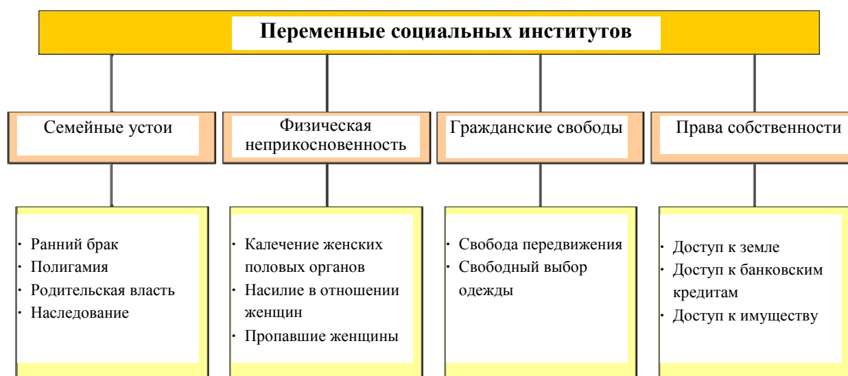
Диаграмма 1: 12 новаторских показателей гендерного равенства

где первый множитель отражает высокий уровень дискриминации, а второй (0,40) – тот факт, что от нее страдают 40% населения.