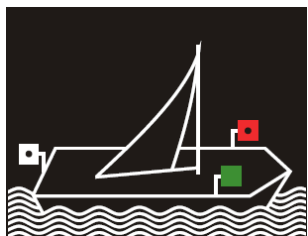
Статья 3.12: Парусные суда.