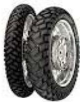
"Metzeler Enduro 3"