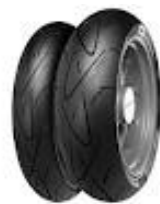
"Continental Sport Attack"