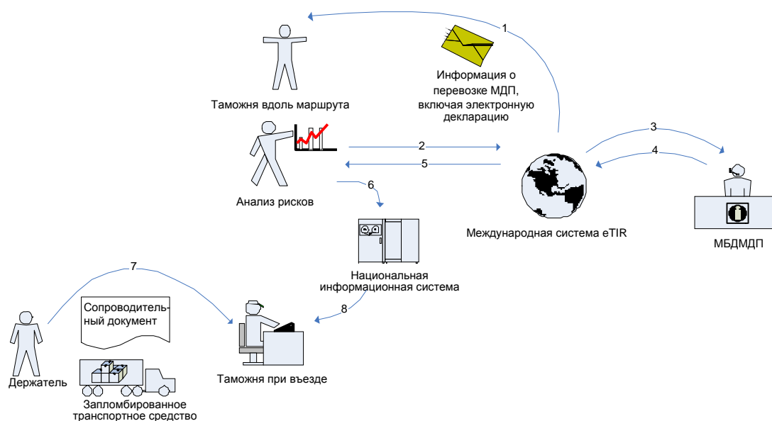
Рис. 2 - Представление декларации в таможене при въезде.

8. На рис. 2 приводится описание всех шагов, связанных с процессом представления декларации в таможене при въезде. Эти шаги пронумерованы и описаны в тексте под рисунком.