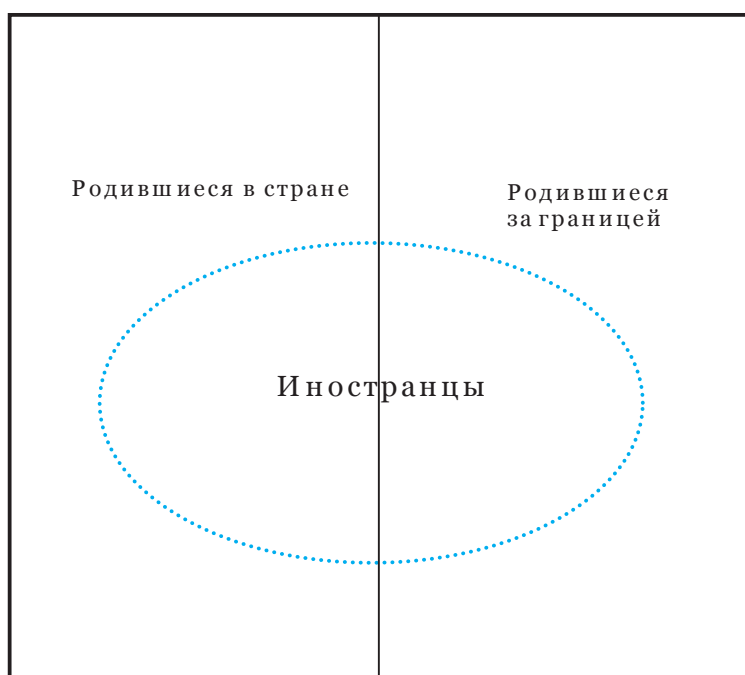
Диаграмма 1: Родившиеся в стране, родившиеся за границей и иностранцы

362. Иностранцы : речь идет о группе лиц, которые не являются гражданами страны. Иностранцами могут быть как родившиеся за границей, так и родившиеся в стране. Лица, имеющие гражданство страны, определяются как граждане.