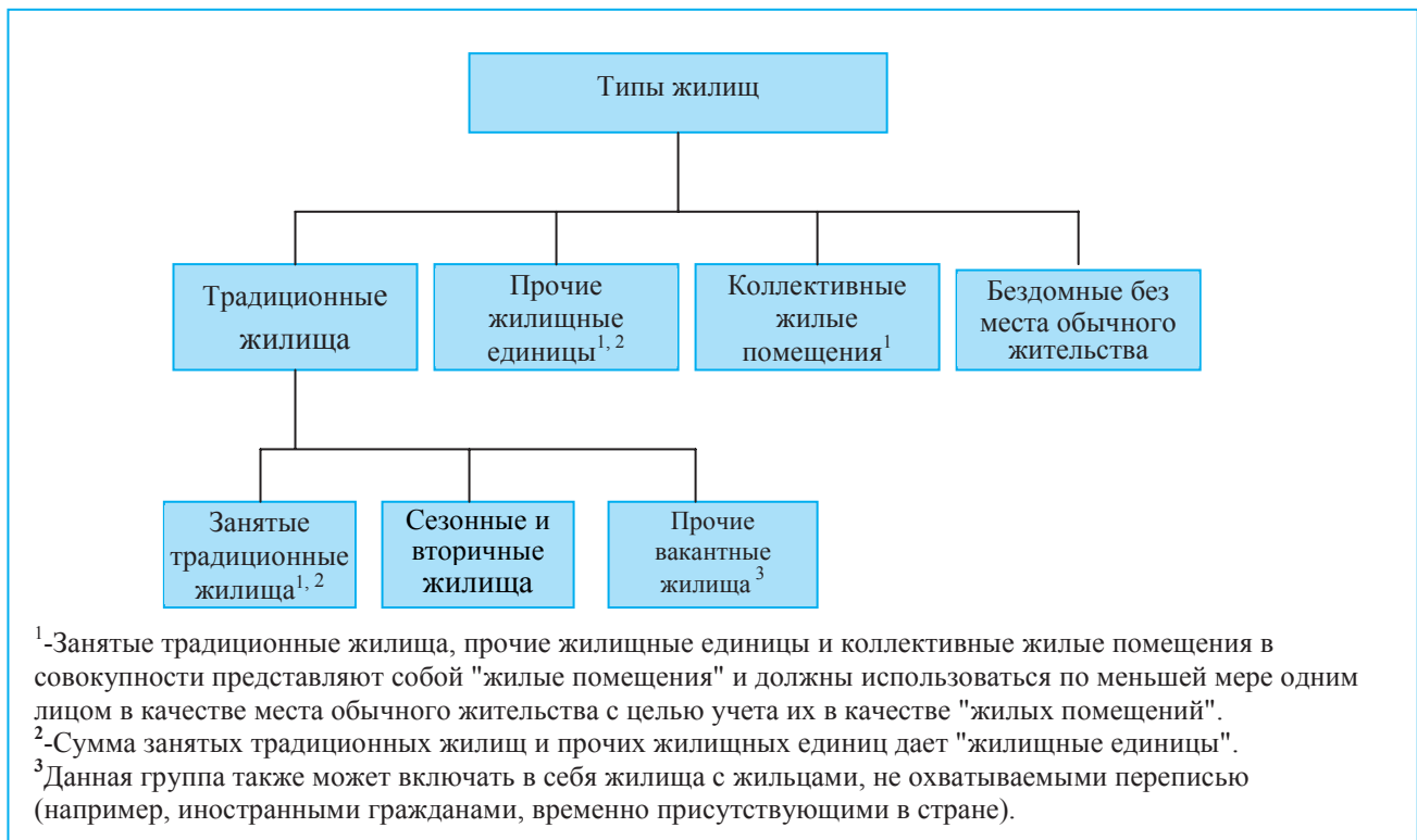
Диаграмма 4. Различные типы жилищ

589. В настоящей главе основное внимание уделяется жилищным признакам и связи между населением и жилыми помещениями. Жилищные признаки могут быть определены как характеристики жилищных единиц и строений, данные по которым собираются в рамках переписи населения. Следует отметить, что некоторые жилищные признаки (например, основной признак "статус владения", описанный выше в пунктах 556-559", и дополнительные признаки "индивидуальное проживание" или "коллективное проживание" и "арендная плата") были отнесены к признакам частных домохозяйств, поскольку основными единицами наблюдения по этим вопросам, как правило, являются домохозяйства. В случае жилищных признаков, описанных в настоящей главе, выделяются две основные единицы наблюдения: традиционные жилища и прочие жилищные единицы. Исключением является признак "жилищные условия", который описывает связь между населением и жилыми помещениями и который может относиться как к отдельным лицам, так и к домохозяйствам. Еще одним исключением является признак "доступность незанятых жилищ для домохозяйств". Диаграмма иллюстрирует все типы жилищ по всей совокупности населения.