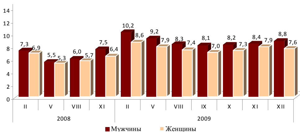
Уровень безработицы среди мужчин и женщин. (в % от экономически активного населения)

25. Более 32% безработных имеют высшее или среднее профессиональное образование. Среди женщин такое образование имеют 40,1%, среди мужчин - 26,5%.