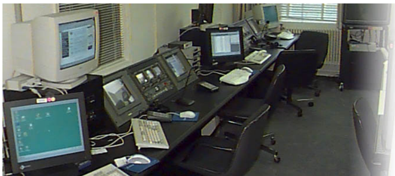
Фотография 1. Помещение для наблюдения и записи, лаборатория для тестирования удобства использования в Бюро переписей

9. После составления подробного плана тестирование удобства использования, как правило, проводится в специально предназначенной для этого лаборатории Бюро переписей. Лаборатория включает три комнаты для тестирования и три пульта наблюдения и записи. Эти пульта находятся в комнате наблюдения рядом с комнатами тестирования (фотография 1). Участник тестирования сидит в одной из трех комнат для тестирования напротив прозрачного зеркала и установленной на стене видеокамеры. Еще одна видеокамера установлена на потолке, и по два микрофона записывают звук в каждой из комнат для тестирования.