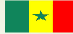
Table ronde de réflexion sur la collaboration transfrontalière autour de l'aquifère sénégalo-mauritanien