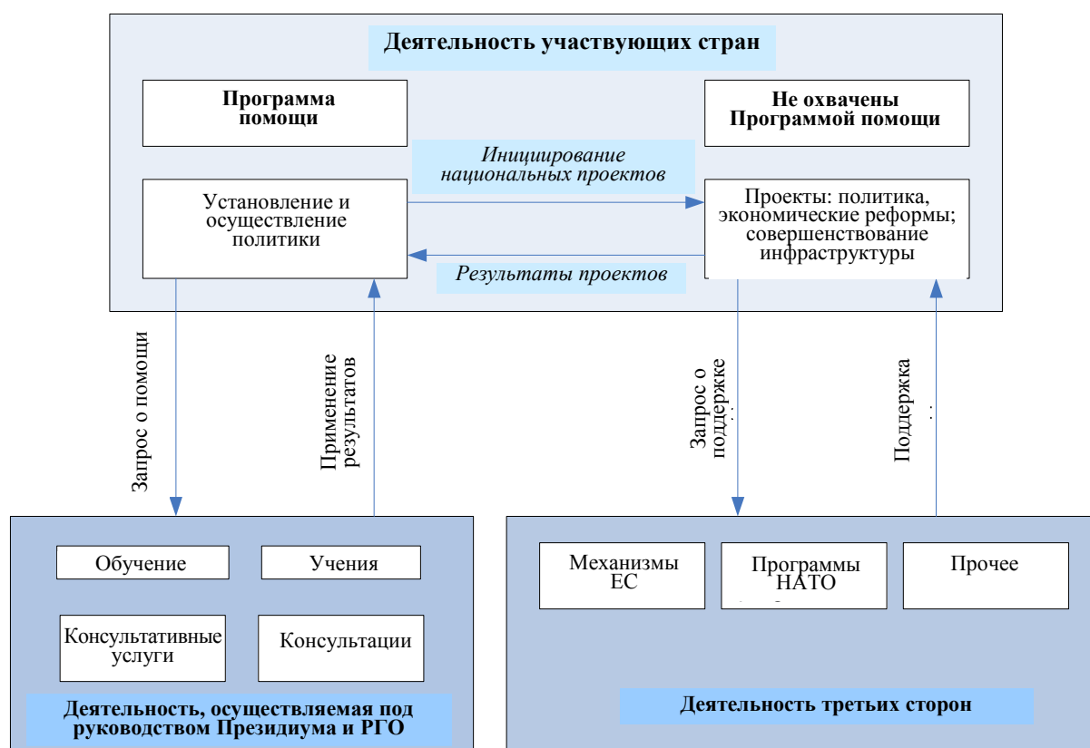
Диаграмма 1. Деятельность, относящаяся к сфере охвата Программы оказания помощи и не входящая в нее

13. Такая деятельность не является непосредственным компонентом Программы оказания помощи, тем не менее стратегический подход обеспечивает участвующим странам средства для разработки конкретных убедительных проектов (например, новые информационные/деловые центры, модернизация спасательного флота), для которых ресурсы могут быть найдены вне рамок Программы оказания помощи.