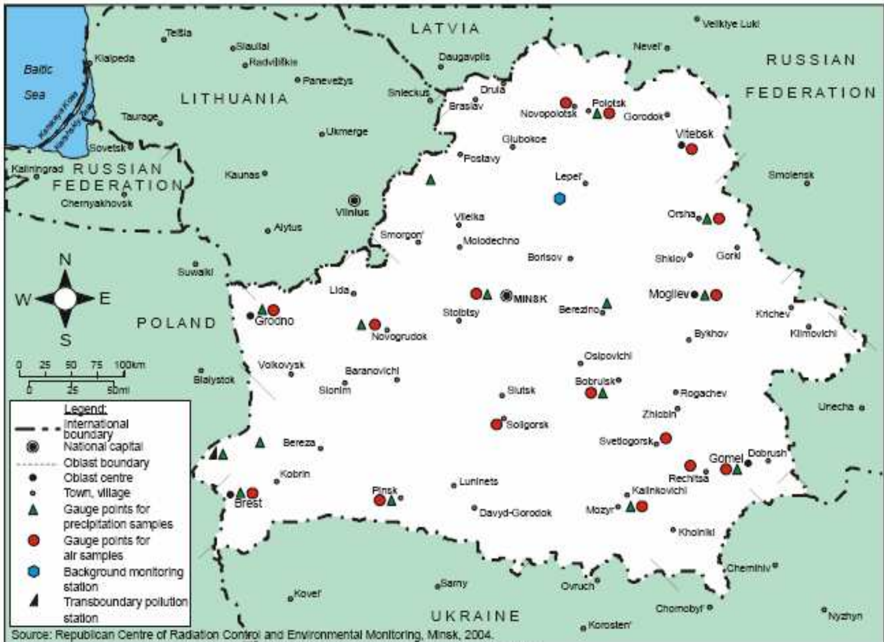
Map 3.1 Atmospheric air observation network

The boundaries and names shown on this map do not imply official endorsement or acceptance by the United Nations.