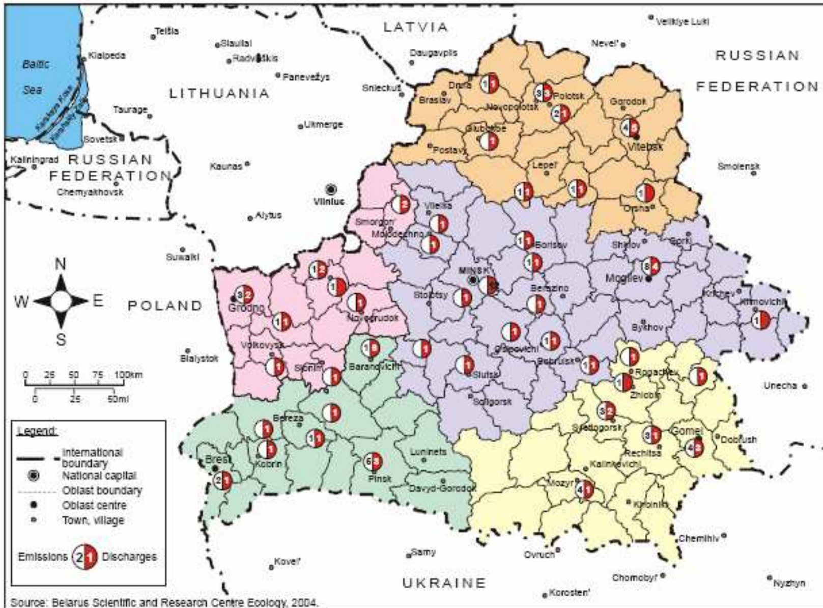
Map 3.3. Enterprises covered by the local monitoring network