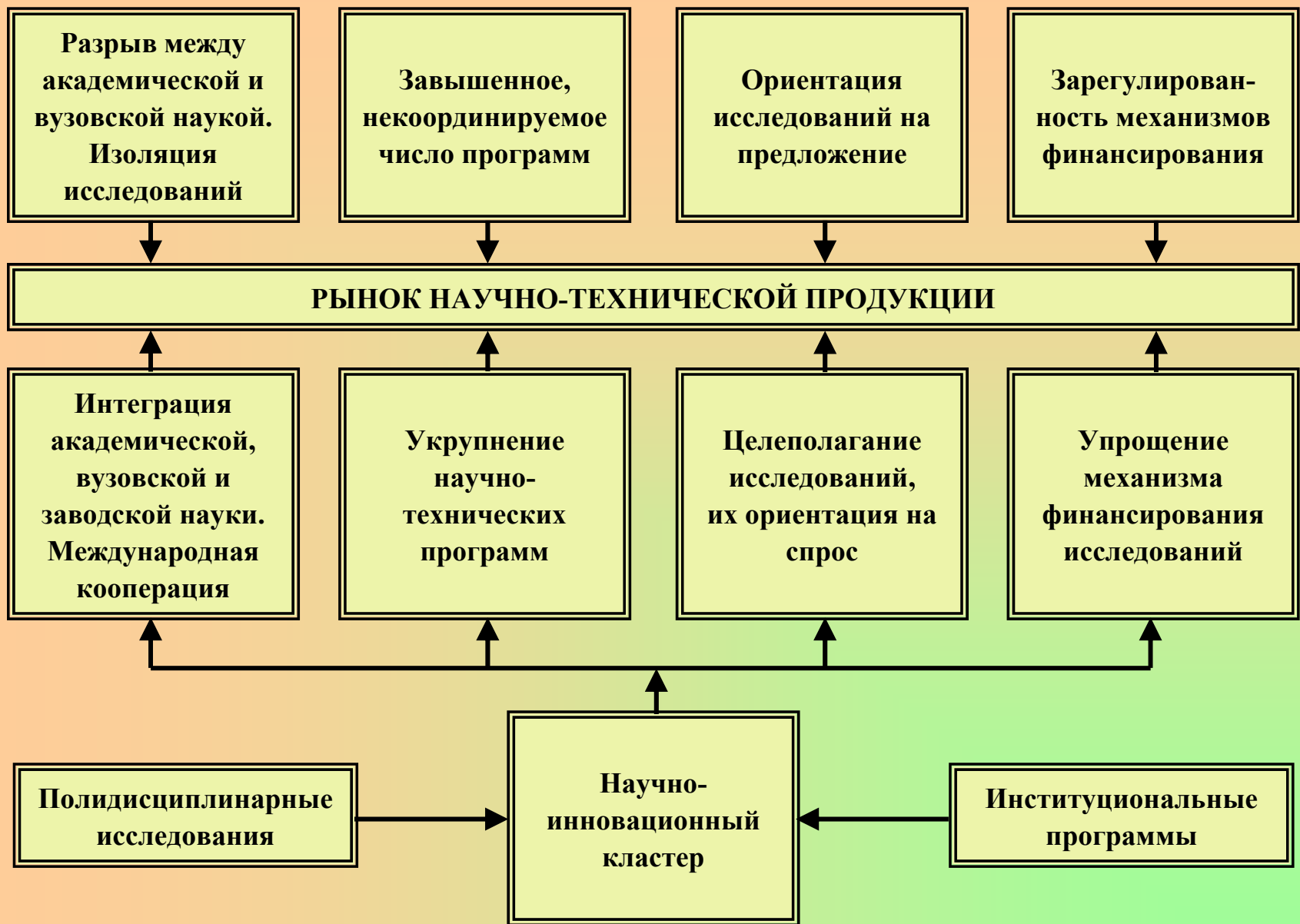
Рисунок 4 - Механизм компенсации негативных факторов рынка научно-технической продукции.