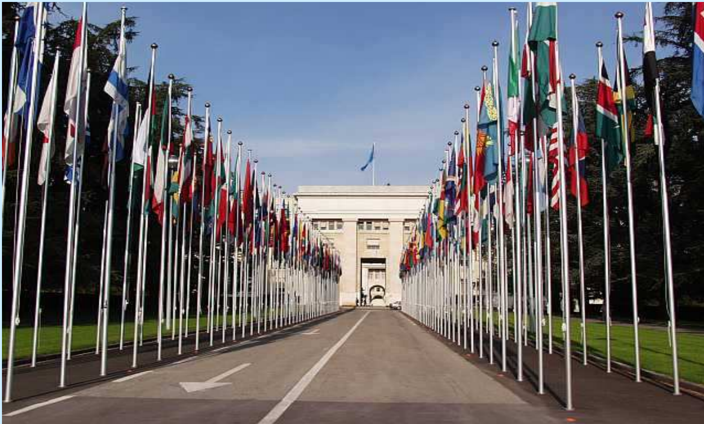
Дворец Наций, Женева (Швейцария)