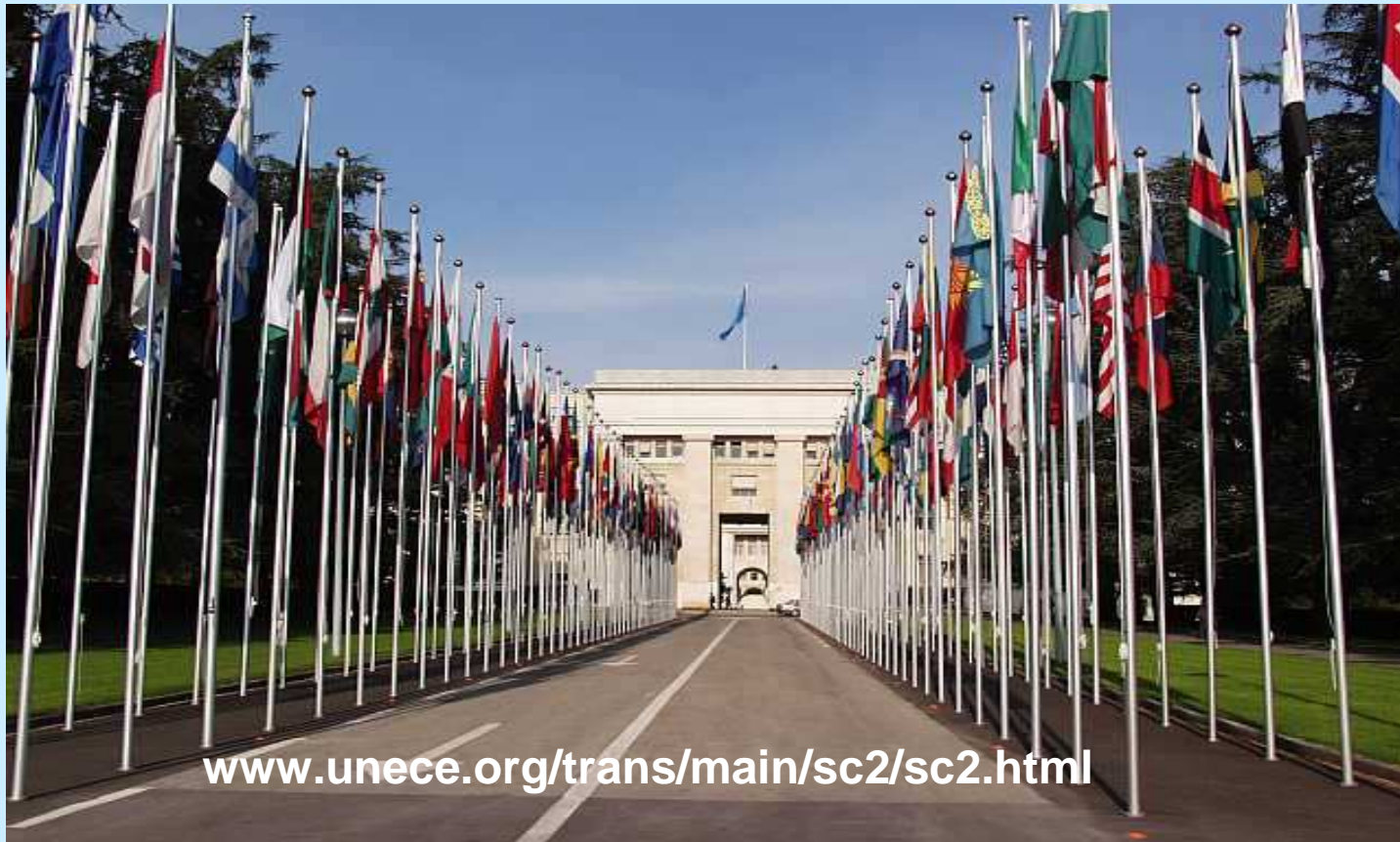
Palais des Nations, Genf (Schweiz)