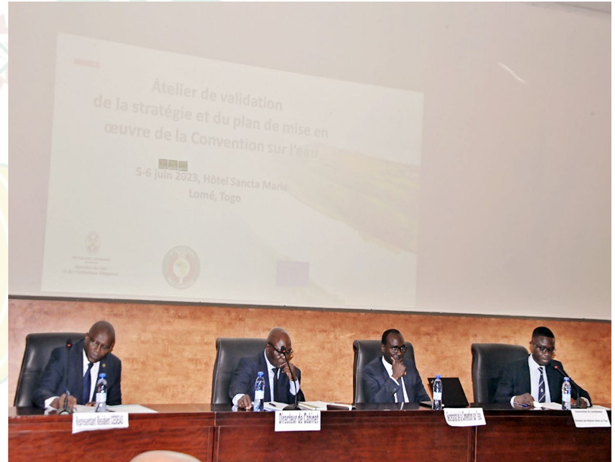
Atelier de validation de la stratégie nationale et du plan de mise en œuvre de la convention sur l'eau de 1992 du TOGO (Juin 2023).