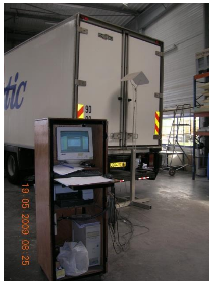
Engin en test d'efficacité dans un centre d'essai

9. L'autorité compétente en France, en lien avec Transfrigoroute France et la station d'essai officielle ATP, le Cemafroid, a étudié de nouveaux protocoles de test pour les plus de 10 000 tests annuels dont environ 5 000 engins non-autonomes. Le but était d'élaborer un test robuste simple et économique.