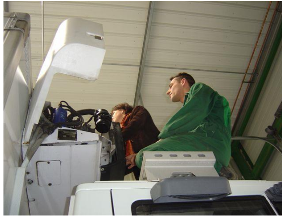
Vérification des équipements par des experts